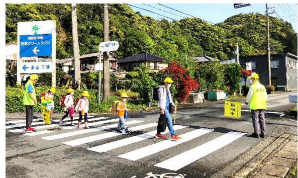
横断歩道を渡る児童と交通安全推進隊の皆様(大原台)